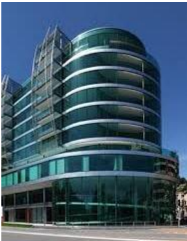
La clinica Seri di Lugano dove si opera con la tecnica dei fotoni

PER PRODURRE la sua prima opera letteraria il «dottor Luce» ha scelto una location particolare: una baita isolata sulle alture di Marguns, nel cantone svizzero dei Grigioni. Una chamanna , come la chiamano i locali, raggiungibile solo a piedi e accompagnati da uno sherpa. Costrui-